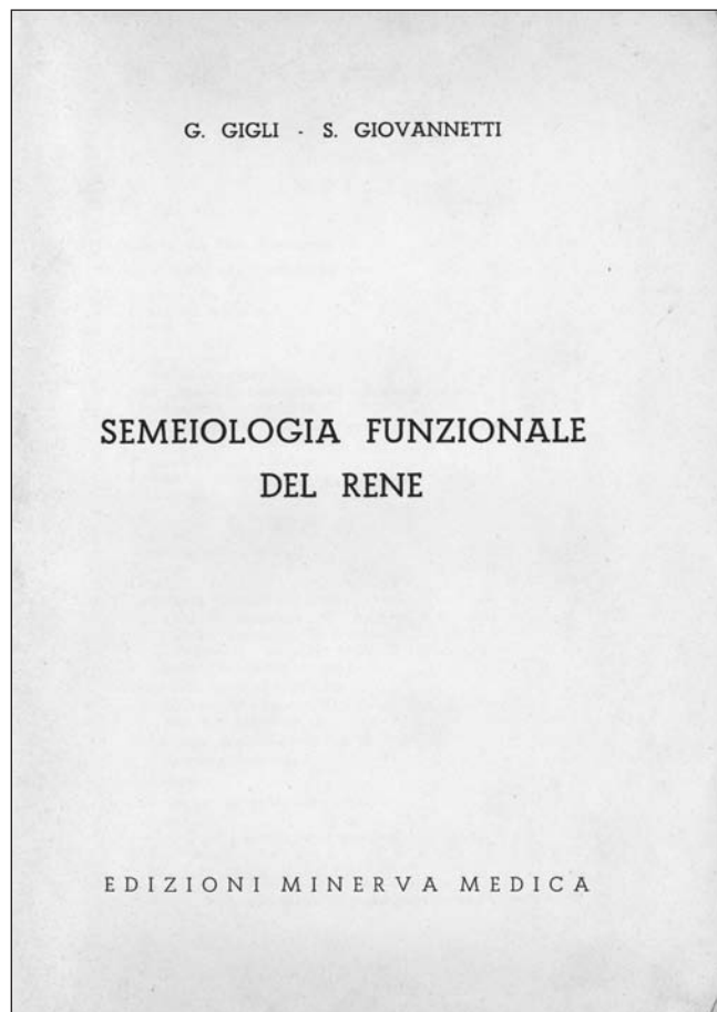
Fig. 2 - Frontespizio della monografia Semeiologia funzionale del rene (4).

Nella sua lunga attività scientifica, Giovannetti ha pubblicato oltre 200 lavori, la maggior parte in lingua inglese, ed alcuni libri in italiano e in inglese (Tab. I). Il primo di questi lavori, risalente al 1951, riguardava la correlazione fra affezioni tonsillari e patologia renale mediante lo studio accurato del sedimento urinario prima e dopo tonsillectomia (2).